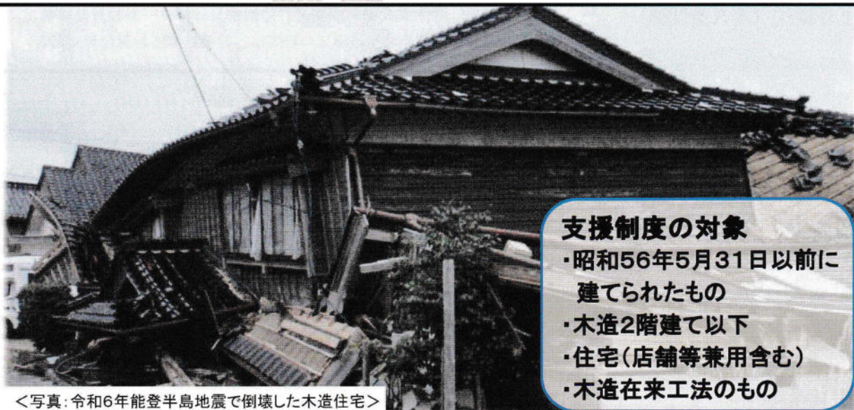
<写真:令和6年能登半島地震で倒壊した木造住宅>