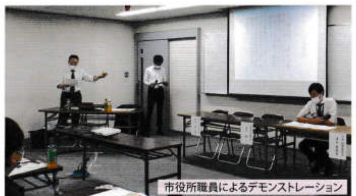
市役所職員によるデモンストレーション