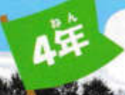
ダイナミック琉球 ～170人の絆～