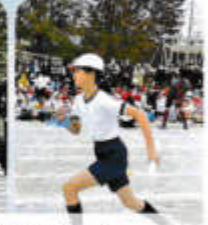
みんなの思いをのせたバトンリレー！