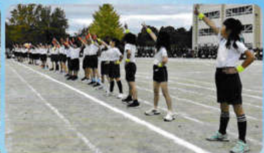
～心を一つにえがおと元気をとどけよう～