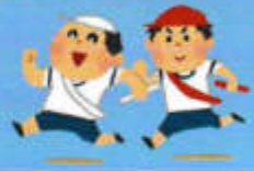
思いっきり走りきりました！