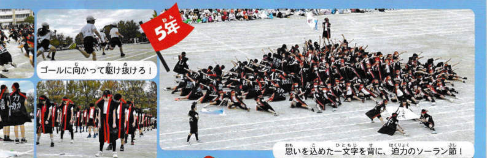
ゴールに向かって駆け抜けろ！