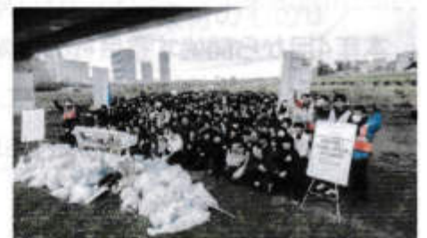
※イベント共催・写真提供「豪田ヨシオ部」