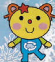
かわさき3R推進キャラクター かわるん