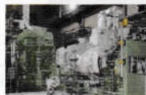
蒸気タービン発電機

ごみ焼却で発生した余熱 を活用し、蒸気タービン発 電機による 自立運転が可能 (一般家庭13,000世帯分の電気)